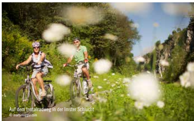
Auf dem Inntalradweg in der Imster Schlucht